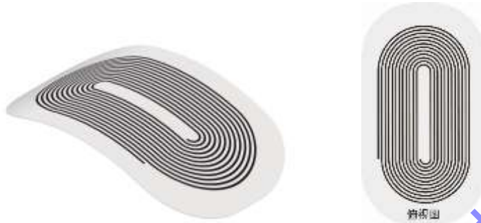
图 1 典型的柔性磁场线圈

线圈本身具有柔性，且线圈固定于柔性基底上，可贴合被检曲面试件表面放置，在柔性电磁超声检测中用于产生偏置磁场的电磁铁（图 1 所示）。