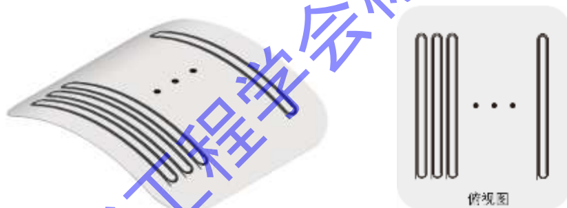
一维跑道型线圈阵列

2 个以上线圈按一定规则排列的线圈组合，单个线圈本身具有柔性且线圈组合固定于柔性基底上，可贴合被检曲面试件表面放置，在柔性电磁超声相控阵表面波检测中用于产生多个感应涡流（图 2 所示）。