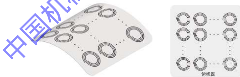
二维环形线圈阵列