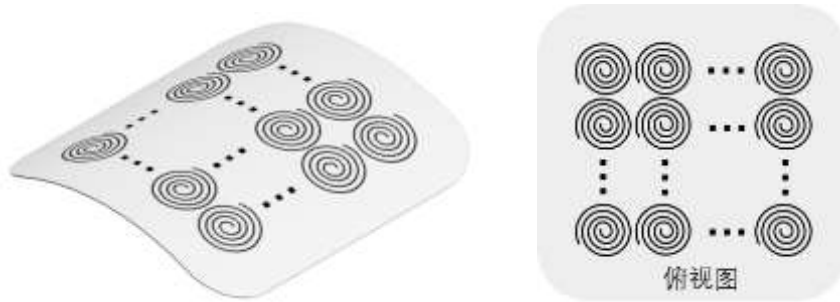
图3 典型的柔性检出线圈阵列(饼形线圈阵列)

上,可贴合被检曲面试件表面放置,在柔性电磁超声相控阵表面波检测中用于接收多个探测信号(图3所示)。